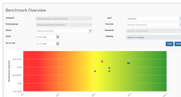
Afbeelding: Benchmark AddVueConnect